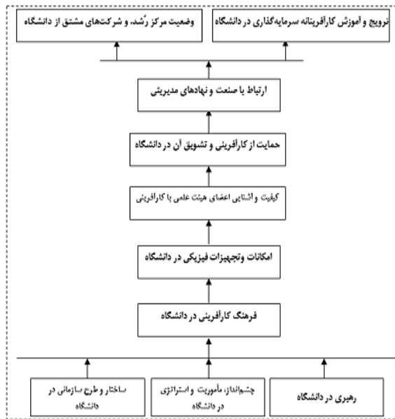
شکل ۲- مدل ISM تحقیق برای عوامل توسعه دانشگاه کارآفرین

در هفت سطح شناسایی شده‌اند. در بالاترین سطح، مؤلفه‌های وضعیت مرکز رشد و شرکت‌های مشتق از دانشگاه و ترویج و آموزش کارآفرینانه سرمایه‌گذاری قرار گرفته است. و در پایین‌ترین سطح، مؤلفه‌های چشم‌انداز، مأموریت و راهبردی در دانشگاه، رهبری در دانشگاه و ساختار و طرح سازمانی در دانشگاه قرار دارد. تمامی ارتباطات بین متغیرها در شکل زیر نشان داده شده است.