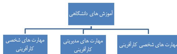
شکل ۱- مدل مفهومی تحقیق

اهداف توسعه صنعتی و تحول رشته‌های دانشگاهی در راستای تحول فناوری و آینده‌نگری را از اهم وظایف خود بدانند [۳۳]. با توجه به افزایش بیکاری دانش‌آموختگان دانشگاهی، در سال‌های اخیر در ایران برای رفع معضل بیکاری در زمینه آموزش کارآفرینی کوشش ویژه‌ای انجام شده است، اما غالب برنامه‌های آموزشی سازمان‌هایی که تصدی این مهم را به عهده داشته‌اند متمرکز بر نیازهای مدیران سازمان‌های بزرگ و متوسط بوده است که غالباً در بخش دولتی و عمومی اقتصاد فعالیت داشته و دارند. بنابراین سازماندهی آگازین کارآفرینی در ایران در گرو شناخت عوامل مساعد و بازدارنده کارآفرینی و راه‌های عملی رفع موانع، ترغیب دانش‌آموختگان مستعد مؤسسات آموزشی به فعالیت‌های کارآفرین و پرورش گروهی از جوانان مستعد کارآفرینی جهت توسعه کسب و کارهای کوچک در راستای ایجاد اشتغال مولد می‌باشد. در این راستا مطالعات مختلفی در زمینه توسعه‌ی مهارت‌های کارآفرینی انجام یافته اما همان‌طوری که در فوق به آنها اشاره شد؛ در بررسی‌ها، تأثیر عواملی از قبیل سن، جنسیت [۲۷] یا برنامه‌های درسی (با لحاظ محتوا و راهبردهای تدریس و هدف) [۱]، بر توسعه‌ی مهارت‌های کارآفرینی مدنظر قرار گرفته‌اند و یا مهارت‌های کارآفرینی در ابعاد شخصی، آموزشی و محیطی [۱۷] یا در قالب مهارت‌های فردی، کاربردی و تفکر انتقادی و خلاق [۲۷] در رشته خاص [۲۸ و ۲۴ و ۲۳] یا دانشکده خاصی [۲۱] مورد بررسی قرار گرفته‌اند. در حالی که با توجه به چارچوب نظری و پیشینه‌ی موضوع، در این مقاله تأثیر آموزش‌های دانشگاهی بر توسعه‌ی مهارت‌های کارآفرینی (در بعد مهارت‌های شخصی، فنی و مدیریتی) دانشجویان دختر رشته‌های مختلف مورد بررسی قرار گرفته است. مدل مفهومی نیز به صورت زیر می‌باشد: