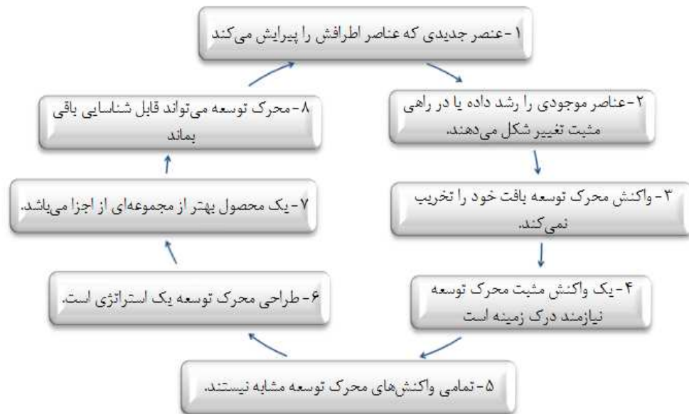
نمودار ۱: مفهوم اصلی محرک توسعه در ۸ ویژگی.

همکاری حمایت‌گرا و مشارکتی برای دستیابی به اهداف استفاده می‌کند، بر اساس بافت شهری (محیط شهری) تعریف می‌شود و عوامل بیرونی در فرایند و نتایج آن تأثیر می‌گذارند (Kongsombat, 2010). توسعه شهری نیازمند ارتباط مفهومی موثر با محیط اطراف خود است و باید به لحاظ محتوایی با مکان خود مرتبط باشد و به تمام روابط متقابل و پویایی که از بافت معماری، فرهنگی و مکانی موجود در بافت مشتق می‌شود، پاسخ دهد. پروژه‌های محرک توسعه شهری به لحاظ فرهنگی، اجتماعی، کالبدی و مکانی به درستی در مکان خود می‌نشینند و در آن ریشه می‌دانند (Bohannon, 2004: 10). شرایط کالبدی بافت شهری فضای بلافضل اطراف خود را بهبود بخشیده و علاوه بر کالبد، بافت اقتصادی و اجتماعی را نیز دچار تغییرات مثبت می‌کنند. این پروژه‌ها در دامنه خود محدود بوده به همین دلیل به بافت آسیب نمی‌رسانند بلکه، کیفیت موجود و ویژگی یک محیط شهری را با توجه به توسعه مجدد، تجدید حیات یا بازآفرینی آن بهبود می‌بخشند (Attoe & Logan, 1989).