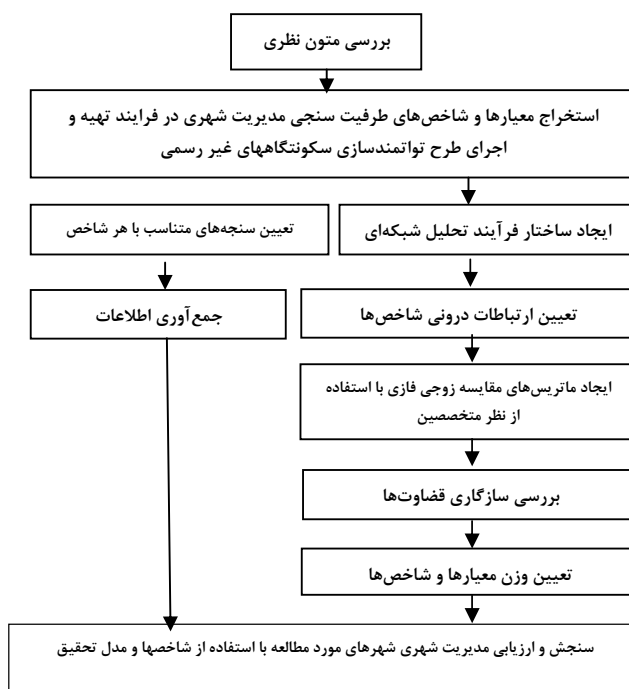
نمودار ۱: چارچوب روش‌شناسی تحلیل یکپارچه

در این پژوهش جهت دستیابی به اهداف موردنظر از سه روش استفاده شده است: ۱. مطالعه کتابخانه‌ای و اسنادی: جهت بررسی متون نظری مرتبط با موضوع پژوهش و شهرهای مورد مطالعه در قالبی تحلیلی - تطبیقی که به تدوین چارچوب نظری و شاخص‌های موردنیاز جهت ارزیابی مدیریتی شهرهای مورد مطالعه شده است؛ ۲. نظرخواهی از متخصصین، مشاهدات میدانی و مصاحبه‌های عمیق: نظر متخصصین در تعیین وزن معیارها مورد استفاده قرار گرفته است در انتخاب متخصصین سعی بر آن بوده که ترکیبی از مدیران شهری، اساتید دانشگاه و حرفه‌مندان (مهندسان مشاور شهرسازی که تجربه تهیه برنامه توانمندسازی در ایران را دارند)؛ ۳. روش‌های کمی: مدل‌کردن نتایج مشاهدات میدانی، مصاحبه‌های عمیق و تعیین وزن نهایی معیارها و شاخص‌ها با استفاده از تلفیق مدل فرآیند تحلیل شبکه (ANP) و (FUZZY). به‌طورکلی چارچوب روش‌شناسی تحلیل یکپارچه در این پژوهش به شکل نمودار (۱) خواهد بود.