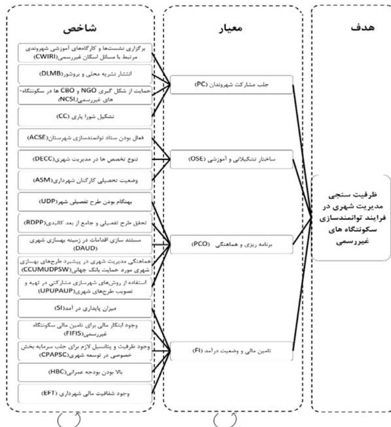
نمودار ۳: مدل شبکه‌ای برای ظرفیت‌سنجی مدیریت شهری در فرایند توانمندسازی سکونتگاه‌های غیررسمی

ماتریس تشکیل شده نیز، می‌بایست محاسبه و مورد تأیید قرار گیرد ( CR < 0.1 ). جدول (۴) نمونه مقایسه دودویی به صورت فازی را نشان می‌دهد؛ حاصل بردار ویژه‌ای است که بخشی از سوپر ماتریس ناموزون ۱ مدل تحلیل شبکه‌ای را تشکیل می‌دهد (W21).