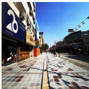
تصویر ۲: خیابان سلمان فارسی بعد از پیاده‌راه‌سازی