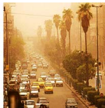
تصویر ۱: خیابان سلمان فارسی قبل از پیاده‌راه‌سازی