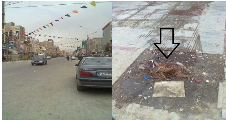
تصویر ۴: ورود وسایل نقلیه به پیاده‌راه، ماخذ: نگارنده تصویر ۵: عدم وجود فضای سبز در مکان‌های تعبیه شده، ماخذ: نگارنده