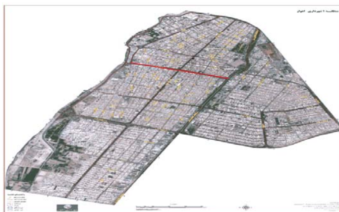
نقشه ۲: موقعیت خیابان سلمان فارسی در منطقه ۱ اهواز