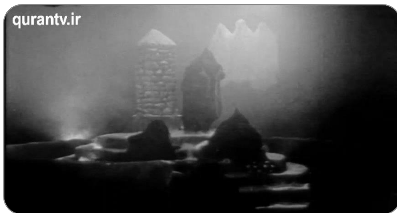
تصویر ۲-۳ فرشتگان از طرف خداوند با ابلیس گفت و گو می کنند.