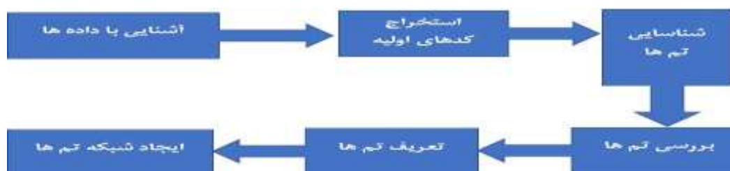
شکل ۱. تفکیک گام های روش تحلیل مضمون (براون و کلارک-۲۰۰۶)

حاضر است. در پژوهش کیفی، تحلیل داده ها بر روی مفاهیم اساسی عبارات و متون انجام می گیرد، لذا عملیات آماری مدنظر نمی باشد و پژوهش ما تحلیل محتوای کیفی (فرا تحلیل) است که به روش کمی-کیفی، صورت بندی و نظم بخشی شده اند. به دلیل عدم استفاده از نظریات و چارچوب های نظری (قیاسی)، فضای این پژوهش مبتنی بر استدلال استقراء و مشاهده است که با روش کیفی تحلیل مضمون بمنظور شناخت و تحلیل اسناد موجود سرانجام گرفته است.