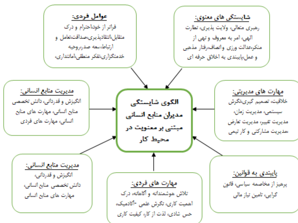
شکل ۱. مولفه‌ها و شاخص‌های پذیرفته شده در پژوهش

ترسیم مدل ساختاری- تفسیری: از نظر عادل آذر، پس از تعیین روابط و سطح متغیرها می‌توان آن‌ها را به شکل مدلی ترسیم کرد. به همین منظور ابتدا متغیرها، برحسب سطح آن‌ها به ترتیب از بالا به پایین تنظیم می‌شوند (۲). در پژوهش حاضر عوامل در چهار سطح قرار گرفته‌اند.