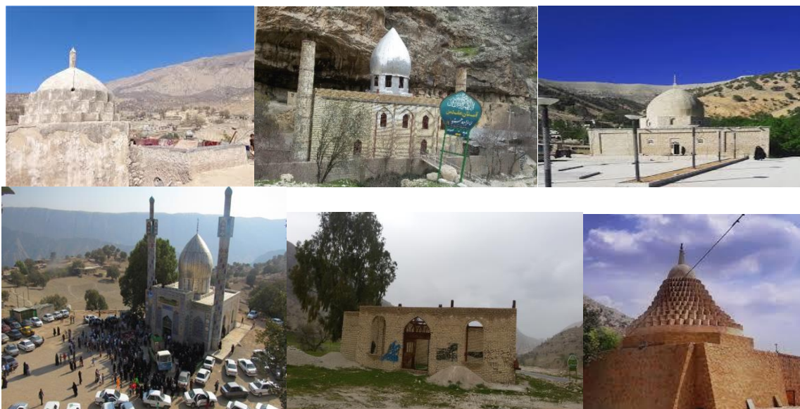
از راست به چپ

امامزاده علی(ع) - امامزاده حمزه(ع) - امامزاده سید الجلال الدین(ع) امام زاده محمود(ع) - امامزاده اسماعیل(ع) - امامزاده یحیی(ع)