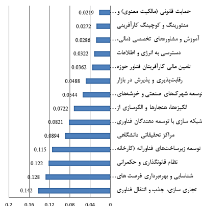
شکل ۲- وزن نهایی ابعاد به روش سوارا

همچنین در ادامه، نمودار وزن نهایی ابعاد اکوسیستم کارآفرینی فناورانه در صنایع تبدیلی ارائه شده است. نتایج تحلیل نشان می‌دهد تجاری‌سازی، جذب و انتقال فناوری بیشترین اهمیت در اکوسیستم کارآفرینی فناورانه در صنایع تبدیلی برخوردار است. شناسایی و بهره‌برداری از فرصت‌های فناورانه صنایع تبدیلی در اولویت دوم است. سایر ابعاد نیز به ترتیب معرفی شده‌اند.