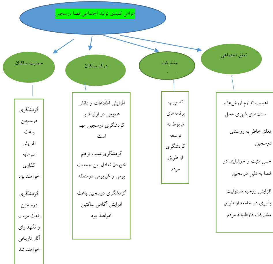
شکل ۳. عوامل کلیدی خوانش فضای اجتماعی در سنجین