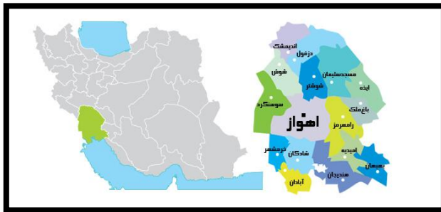
شکل ۱. موقعیت جغرافیایی خرمشهر

ساختمان در زمان اشغال، به عنوان محل دیدبانی نیروهای عراقی بود. دست نوشته‌های عراقی‌ها بر روی دیوارهای ساختمان، دست نخورده باقی مانده است. بعد از جنگ این ساختمان به یک موزه و مرکز فرهنگی تبدیل شد. این موزه شامل ۶ غرفه در دو طبقه است که در غرفه اول، خرمشهر در دوران قبل از جنگ و در غرفه دوم، خرمشهر اشغال شده و مقاومت ۳۵ یا ۴۵ روزه رزمندگان و در غرفه سوم ۱۹ ماه اشغال شهر و آزادسازی خرمشهر در عملیات بیت‌المقدس، در غرفه چهارم آزادسازی شهر و بازگشت مردم، در غرفه پنجم بازسازی و پاکسازی شهر از مین‌ها و در غرفه ششم نیز تصاویری از زندگی مجدد و بازگشت مردم به شهر تصویر شده است. هر بخش گوشه‌هایی از حماسه آن دوران را همراه با نمایش آثار به جامانده از برخی شهدای خرمشهر و نیز ادوات نظامی آن دوران به نمایش گذاشته شده است. علاوه بر این، موزه دارای کتابخانه تخصصی مربوط به جنگ، سالن نمایش فیلم، آرامگاه سه شهید گمنام است.