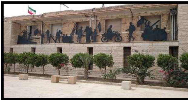
شکل ۲. نمای بیرونی ساختمان موزه