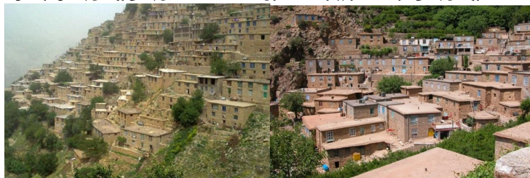
شکل (۴) روستای اورامان تخت کردستان شکل (۵) روستای هجیج در استان کرمانشاه