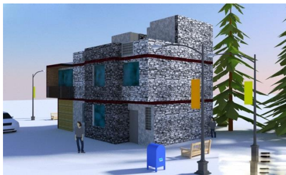
شکل (۶) فرمهای بسته و فشرده و مکعبی شکل به هم چسبیده پشت به پشت در جهت محور شمالی جنوبی بصورت مرتفع ارجعیت دارند