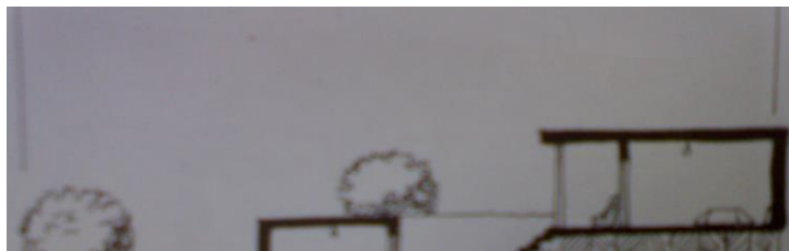
شکل (۷) برش یک خانه روستایی در منطقه کوهستان

در این مناطق برای جلوگیری از تبادل حرارتی بین داخل و خارج بنا از بازشوهای کوچک و به تعداد کم استفاده می کنند. در صورت بزرگ بودن پنجره ها، استفاده از سایبان الزامی است. بازشوها در ضلع جنوبی برای استفاده هر چه بیشتر از تابش آفتاب، بزرگتر و کشیده تر انتخاب می شوند. همچنین از استقرار بازشوها در جهت بادهای سرد باید اجتناب نمود. پنجره های دو جداره نیز برای رساندن تبادل حرارتی به حداقل ممکن مناسب ترند. در ضمن به منظور جلوگیری از ایجاد سوز در داخل و خروج حرارت داخلی به خارج ساختمان، میزان تعویض هوای داخلی و تهویه طبیعی را باید به حداقل ممکن رساند. در مقایسه با اقلیم گرم و خشک ابعاد بازشوها در این حوزه اقلیمی برای استفاده از انرژی حرارتی حاصل از تابش آفتاب افزایش یافته است.