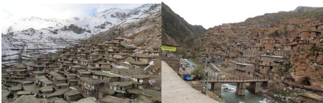
شکل (۲) روستای پلکانی سر آقا سید در چهارمحال بختیاری شکل (۳) خانه های پلکانی روستای پالنگان کردستان

در اقلیم های کوهستانی، مصالح به کار گرفته شده در ساختمان ها، بیش تر از محیط اطراف اخذ شده اند و آب و هوا نیز در کنار عوامل اقتصادی، فرهنگی و... نقش اساسی را در معماری مسکن در این روستاها دارد. در این مناطق، ساختمان ها بیش تر از سنگ بنا شده اند که در بعضی قسمت ها، دیوارهای خشکه چین با سنگ، هم اکنون نیز معمول است (رفیع زاده، ۱۳۷۵). «در مناطق کوهستانی، جایی که جنگل وجود داشته است، از چوب درختان جنگلی در ساختمان سازی استفاده شده است.» (پاپلی یزدی و وثوقی، ۱۳۷۰).