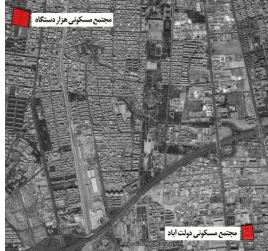
تصویر ۱: نقشه هوایی دو محله هزار دستگاه و دولت آباد