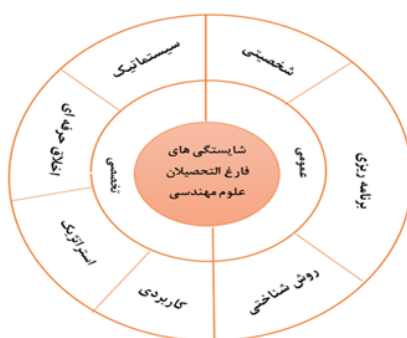
شکل شماره: ۱. مدل مفهومی پژوهش

می‌گردد (۵۳). استفاده از کامپیوتر و اینترنت به‌عنوان ابزار کار، فناوری گردش اطلاعات در سازمان، مهارت فناوری اطلاعات و ارتباطات، توانمندی بهره‌گیری از شبکه‌های اطلاعاتی، آشنایی با فنون نوین رشته، توانایی درک نیازهای بازار، تسلط به زبان خارجی، مهارت فنی رشته (روش‌های نوین ساخت، مدیریت ماشین‌آلات، اندازه‌گیری و برآورد، راه‌اندازی و تجهیز کارگاه) و مهارت‌های عددی و محاسباتی در طبقه شایستگی‌های کاربردی قرار گرفته‌اند. شایستگی‌های کاربردی، مهارت‌ها و صلاحیت‌هایی می‌باشند که موجب افزایش بهره‌وری افراد در کار می‌شوند (۹۷). در طبقه سوم مفاهیم (مهارت) تخصیص منابع، مسئولیت، مدیریت اقتصادی، کارایی، تمرکز بر مشتری، مدیریت منابع، مهارت کنترل فرایند، مدیریت کیفیت، بهره‌وری) قرار گرفته که مربوط به شایستگی‌های اخلاق حرفه‌ای می‌باشند. این شایستگی‌ها کاربرد روش‌های اخلاقی برای رفتارهای مهندسان در انجام کار است. از طرفی به‌عنوان استانداردهای حرفه‌ای در نظر گرفته می‌شود که افراد در جریان کار مهندسی با آن‌ها روبه‌رو می‌شوند (۹۸). و در نهایت در طبقه چهارم مفاهیم مهارت هدایت و راهبری (هدف‌گذاری و سیاست‌گذاری، مدیریت ارزش، تدوین چشم‌انداز سازمان، تشکیل تیم و تخصیص نقش‌ها در پروژه، مدیریت منابع انسانی و انگیزش)، مدیریت تعارض (توانایی حل تعارضات و مشاجرات) و مهارت داشتن چشم‌انداز، تفکر استراتژیک و راهبردی قرار گرفته است که مربوط به شایستگی‌های استراتژیک است.