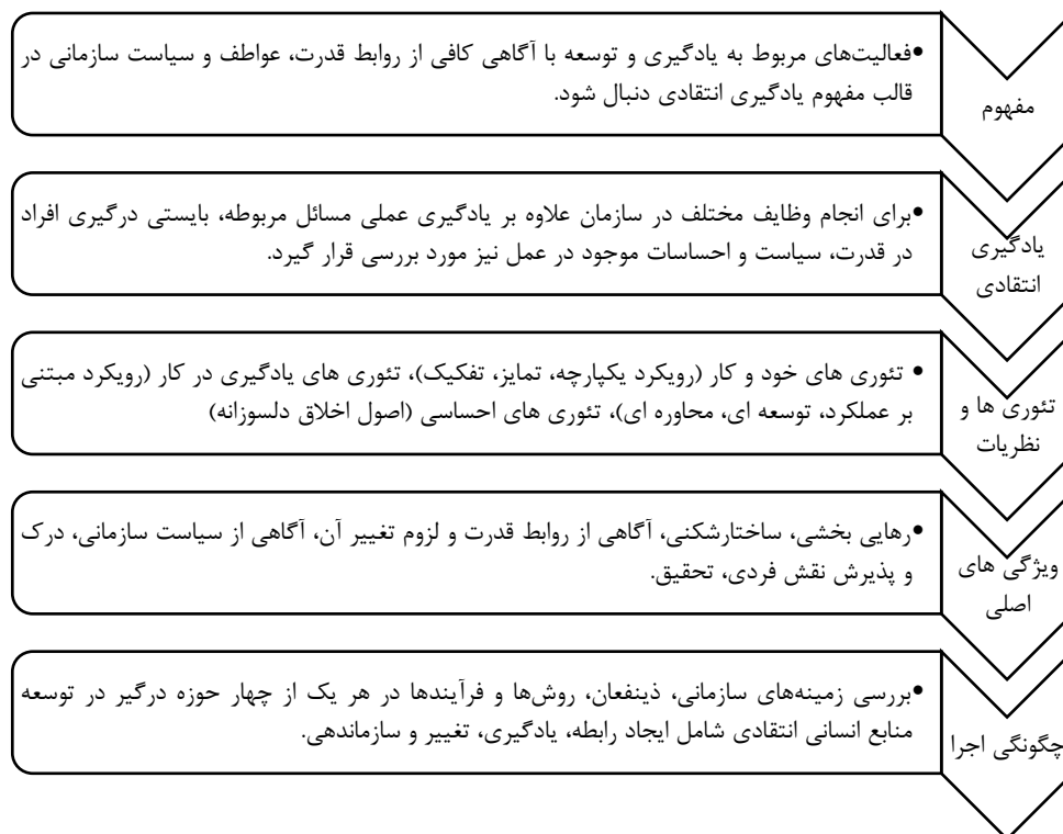
شکل شماره (۲) چارچوب توسعه منابع انسانی انتقادی (محقق ساخته)