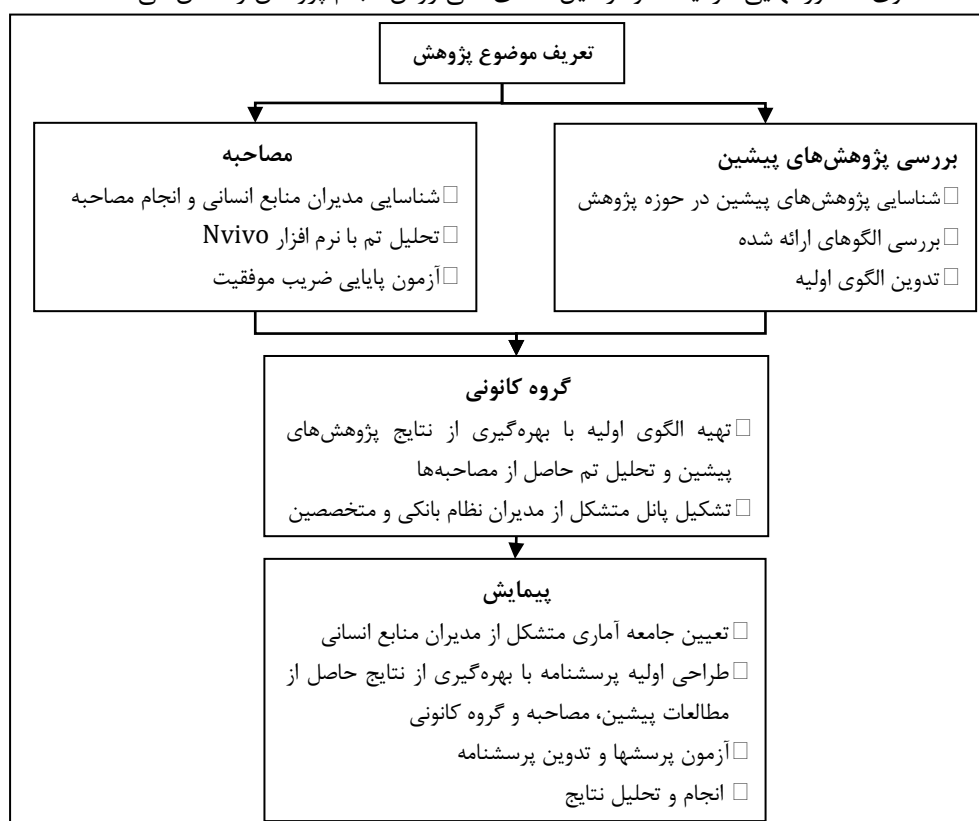
شکل ۱: فرایند اجرای پژوهش

یا استفاده از روش‌ها به صورت موازی یا همزمان (۲۳) (نیومن، ۱۳۹۵)؛ در این پژوهش شیوه متوالی بکار گرفته شده است. به منظور تحقق اهداف پژوهش، با مطالعه سوابق پژوهش‌های پیشین، شناختی از وضع موجود در این زمینه حاصل و مدل‌ها و چارچوب‌های موجود بررسی گردیده است. با عنایت به وجود الگوهایی در خصوص شایستگی‌های مدیران منابع انسانی، به‌منظور دستیابی به الگویی جامع، از روش بررسی مستندات استفاده شد. در ادامه از طریق مصاحبه عمیق با مدیران منابع انسانی نظام بانکی ضمن در نظر داشتن بافت و زمینه پژوهش، نسبت به اخذ نظرات آنها در ارتباط با شایستگی‌های مدیران منابع انسانی اقدام، و با بکارگیری روش تحلیل تم، الگوی شایستگی اولیه تدوین شد. در ادامه گروه کانونی از متخصصین منابع انسانی در صنعت بانکداری و اساتید صاحب‌نظر در حوزه منابع انسانی برای همکاری در طراحی و اعتباربخشی به چارچوب الگوی شایستگی تشکیل گردید و در این خصوص هم‌اندیشی و توافق صورت پذیرفت. در نهایت به منظور نهایی‌سازی مولفه‌های شایستگی و اولویت‌بندی آنها، پرسشنامه‌ای تدوین و در اختیار کلیه مدیران منابع انسانی بانک‌های کشور قرار داده شد و در خاتمه الگوی مذکور نهایی گردید. نمودار ذیل شمای کلی روش انجام پژوهش را نشان می‌دهد.