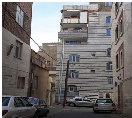
تصویر ۳: استفاده نکردن از پارکینگ و پارک کردن خودرو جلوی در پارکینگ

می‌باشد و پارک کردن خودرو در این محل به عادت روزمره برای ایشان تبدیل شده است. در تصویر بالا مشاهده می‌شود که مالک این خودرو با پارک کردن خودروی خود در این مکان تقریباً مسیر ورودی و خروجی کوچه مجاور ساختمان را مسدود کرده است و در صورت بروز حوادث غیر مترقبه می‌تواند پیامدهای جبران‌ناپذیری را برای ساکنان این کوچه به دنبال داشته باشد. علاوه بر این در تصویر یادشده مشاهده می‌شود که چگونه مالک این ساختمان فقط به تأمین یک پارکینگ در یک ساختمان شش طبقه‌ای بسنده نموده است و با اختصاص کلیه تراکم احداث‌شده به کاربری مسکونی، از تأمین پارکینگ‌های بیشتر خودداری کرده است.