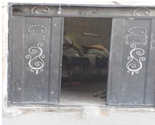
تصویر ۲: تبدیل فضای پارکینگ به کارگاه تولیدی مُبل