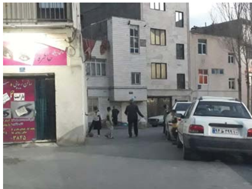
تصویر ۱: محدود شدن فضای بازی کودکان در کوچه‌های فرعی محله یافت آباد جنوبی

برخی آسیب‌ها و اختلالات اجتماعی و فرهنگی را در فرایند جامعه‌پذیری کودکان به دنبال داشته باشد. در همین رابطه تصویر شماره ۱ نشان می‌دهد که چگونه امنیت جانی و روانی کودکانی که حتی در کوچه‌های فرعی در حال بازی کردن هستند، در معرض تهدید قرار گرفته است.