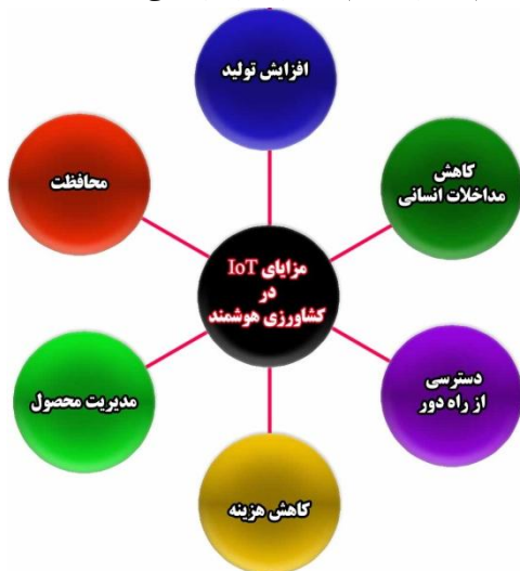
شکل ۱- مزایای فناوری اینترنت اشیا در کشاورزی

به موقع آفت و بیماری در گیاهان بسیار ضروری است. حسگرهای کنترل آفات، پارامترهای محیطی و رشد آفات را مانیتور می‌کنند [۱۵]. با استقرار اینترنت اشیا مجهز به حسگرهای کنترل آفت، کشاورزان می‌توانند اطلاعات کامل مربوط به حمله آفات را دنبال کنند. براساس داده‌های دریافتی، آفت‌کش‌ها به‌طور خودکار در مزرعه اسپری می‌شوند. شبکه‌های حسگر بی‌سیم بر توسعه آفات نظارت می‌کنند و براساس رشد آفات، سیستم میزان مواد شیمیایی مورد نیاز را اندازه‌گیری کرده و به‌طور خودکار آن را فعال و از این طریق سلامتی محصول را حفظ و از ورود مقدار زیاد سم به اکوسیستم گیاهان جلوگیری می‌کند.