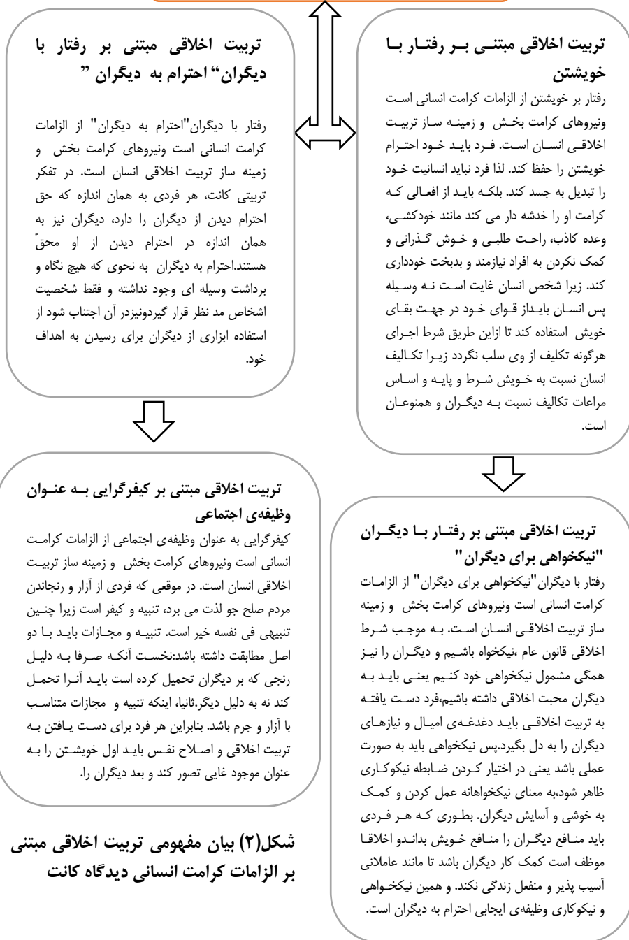
شکل (۲) بیان مفهومی تربیت اخلاقی مبتنی بر الزامات کرامت انسانی دیدگاه کانت