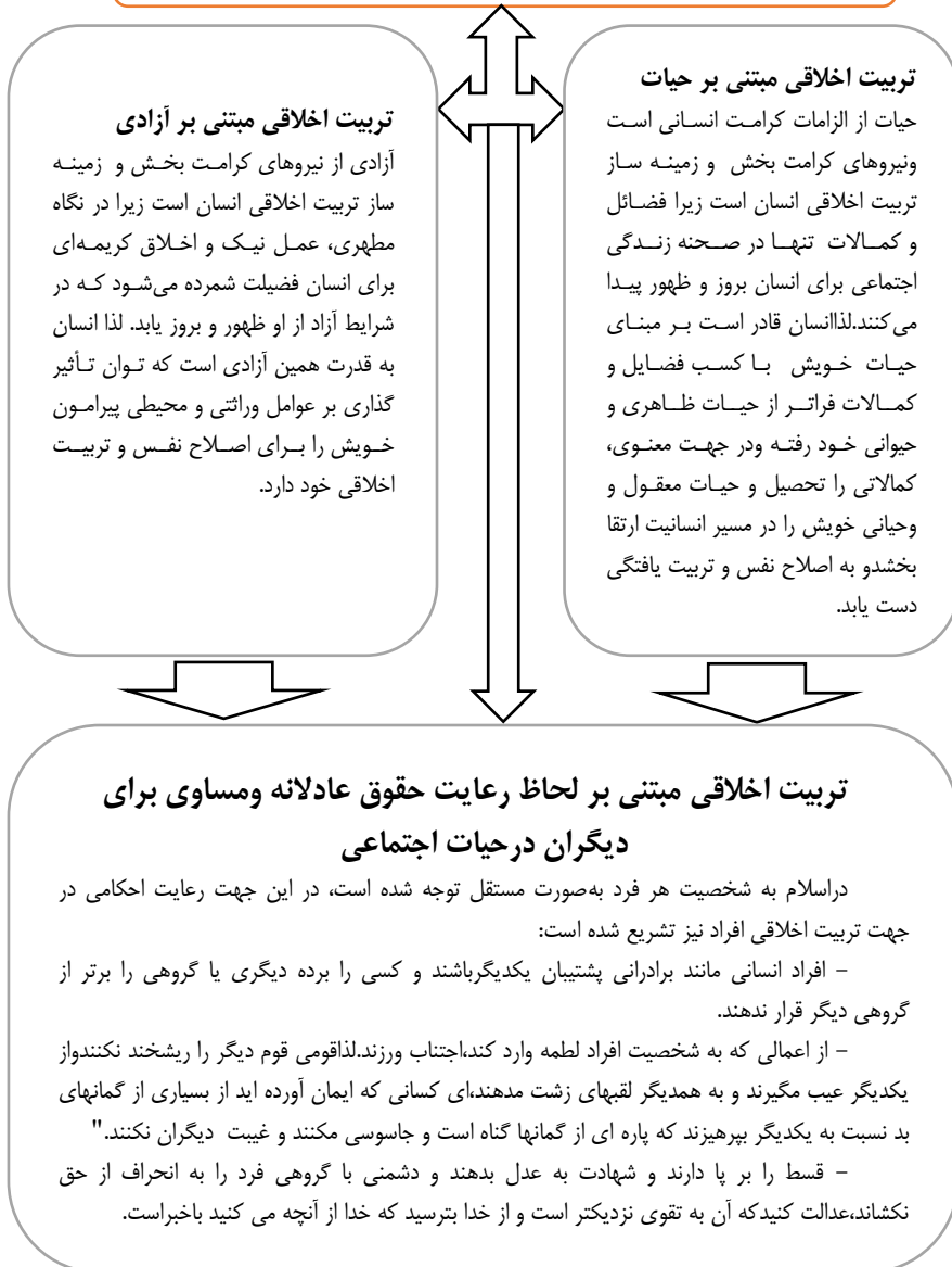
شکل (۱) بیان مفهومی تربیت اخلاقی مبتنی بر الزامات کرامت انسانی دیدگاه مطهری